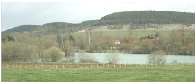
Structure paysagère générale de la ZSC (YB – CENCA)

La Zone Spéciale de Conservation (ZSC) à chiroptères de la vallée de l'Aujon se situe au centre-ouest du département de la Haute-Marne, au sein de la grande région naturelle du Barrois. La ZSC s'inscrit dans un territoire très rural dédié aux grandes cultures et à la forêt. L'élevage bovin, autrefois très répandu, y connaît une forte régression, accentuée depuis le début des années 2000. L'élevage ovin, également jadis ici bien développé, a quant à lui quasiment disparu.