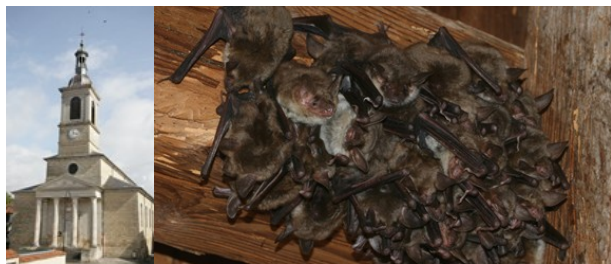
Eglise d'Orges (YB – CENCA) et colonie de mise bas de Grands Murins (M. SOL)

Les habitats naturels de la ZSC n'ont pas été étudiés dans le cadre du DOCOB. Néanmoins celle-ci abrite