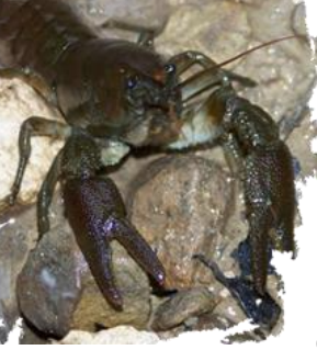
Écrevisse à pieds blancs

Vau est menée par la Fédération Départementale et l'Association locale Agréée pour la Pêche et de la Protection des Milieux Aquatiques. De même un étang communal a été créé pour la pratique de la pêche. Il représente un des seuls ouvrages hydrauliques limitant la libre circulation des espèces piscicoles sauvages.