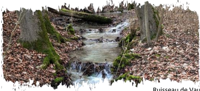
Ruisseau de Vau

Située à la limite de la Haute-Saône et de la Haute-Marne, la ZSC « Ruisseaux de Vaux-la-Douce et des Bruyères » couvre les linéaires étroits et peu profonds des ruisseaux de Vau et de la Verrerie. Entre eaux vives et eaux calmes, ces petits cours d'eau sont reconnus pour leur qualité et pour l'absence de travaux hydrauliques permettant la préservation des espèces animales et des milieux humides. Une révision du périmètre a d'ailleurs été entreprise afin d'intégrer plus de 1 500 hectares d'habitats et d'espèces remarquables aux abords de ces ruisseaux et de celui des Bruyères.