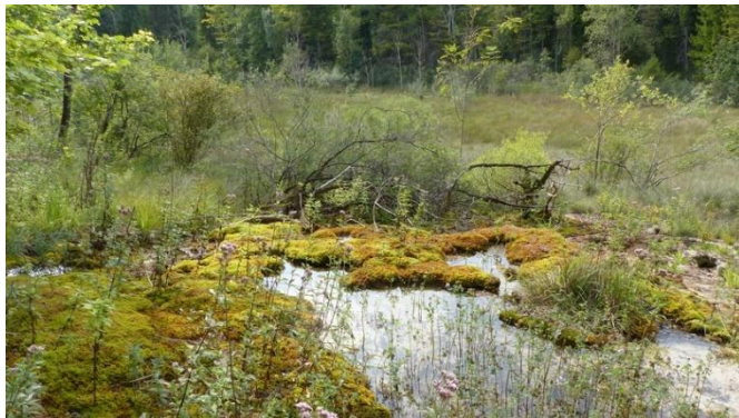
Marais de la Combe des Roches à Chameroy

Il s'agit des plus beaux sites de France pour ce type d'habitats naturels. Cet ensemble est constitué d'une trentaine de marais tufeux assez semblables et peu éloignés géographiquement. Ce sont des marais intra-forestiers peu perturbés.