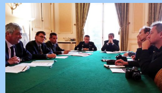
Présentation du bilan provisoire 2013 et période estivale de la délinquance et de la sécurité routière en Haute-Marne