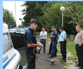
Contrôle du trafic fluvial sur le canal, réalisés conjointement par la compagnie de gendarmerie de Chaumont, les agents des voies navigables ; les militaires de la brigade nautique et l'équipe «stupéfiants» de Chaumont