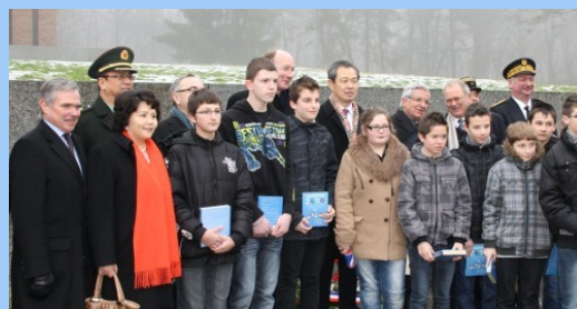
Visite de S.E.M. KONG Quan, ambassadeur de Chine au Mémorial à Colombey les deux Eglises le 28/01/2013