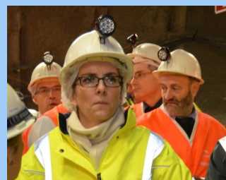
Visite de Delphine Batho, ministre de l'écologie, du développement durable et de l'énergie au Laboratoire souterrain de Bure-Saudron le 04/02/2013