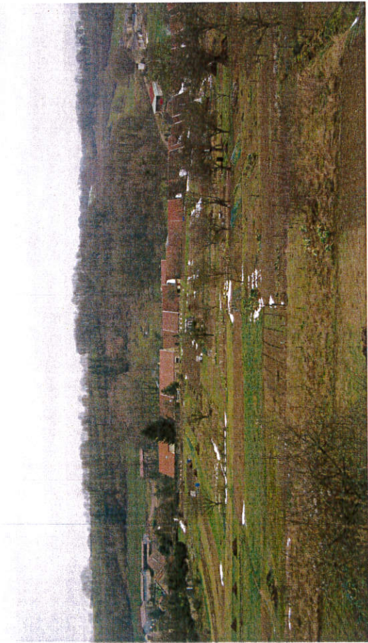
Vue depuis les jardins suspendus en direction d'Heuilley-Cotton