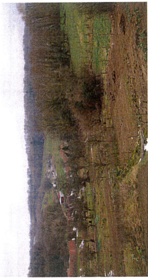
Vue depuis les jardins suspendus en direction d'Heuilley-Cotton