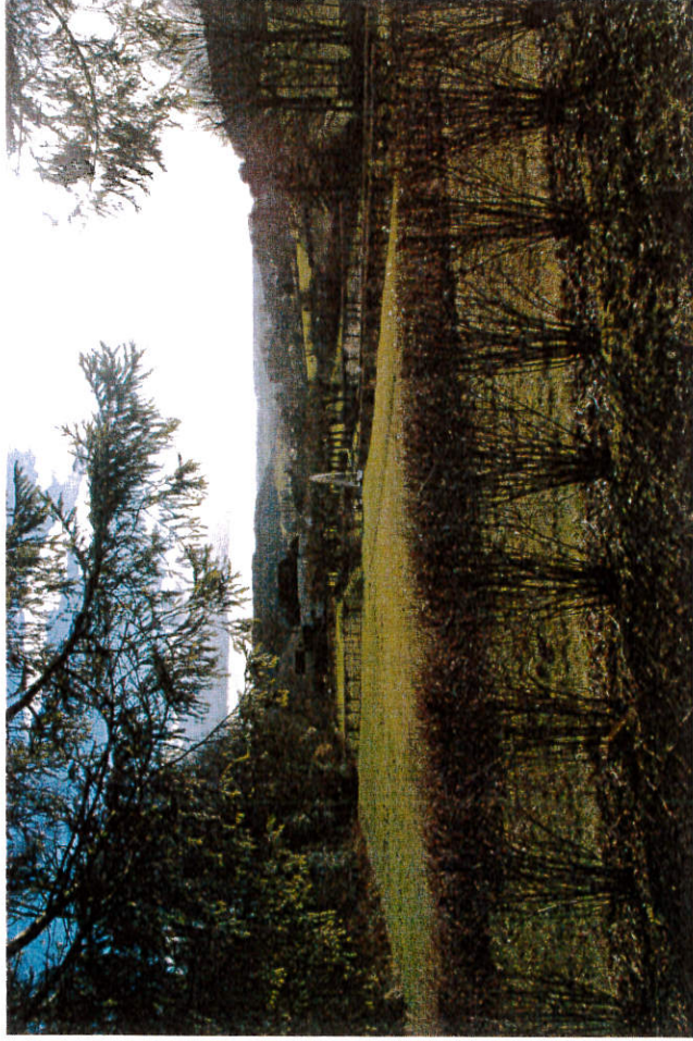
Vue depuis le parc de Silières