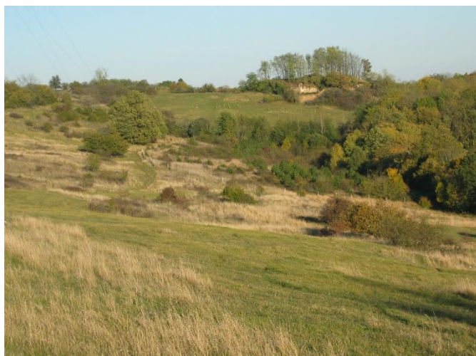
Vue sur la pelouse

Le site Natura 2000 n°3 « Rebord du plateau de Langres de Cohons à Chalindrey » se situe au sud-est de Langres, en Haute-Marne. Trois secteurs peuvent être distingués : le secteur est du site Natura 2000 comprenant le Fort du Cognelot, ouvrage militaire désaffecté, les pelouses sèches du Cognelot et du Pailly, vaste étendue de pelouses calcicoles témoins des anciens pâturages extensifs, le secteur central constitué du Bois de Cerfol et des falaises de Cohons et le secteur ouest constitué des Bois de Vergentière et de la Haie. Des boisements de type hêtraie calcicole et chânaie pubescente riche en buis et en tilleuls occupent les versants, tandis que la chânaie-charmaie croît sur le plateau.