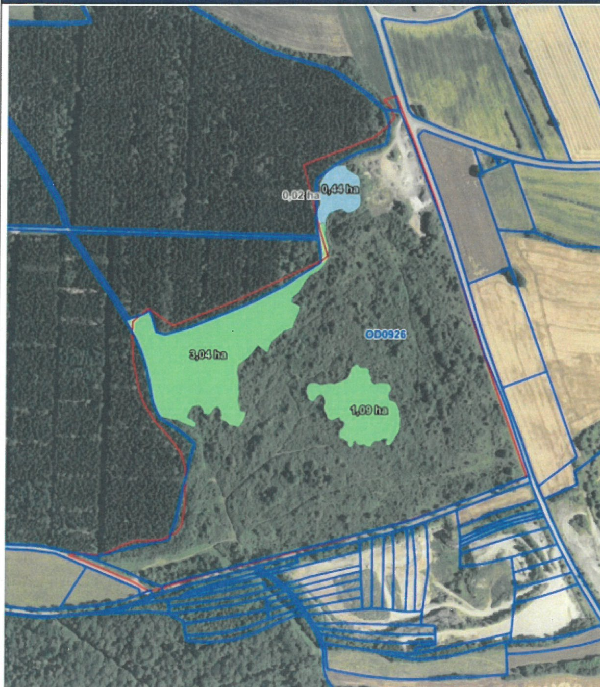
Figure 1 - Carte des zones à défricher superposées au cadastre